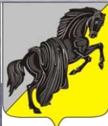
СХЕМА ВОДОСНАБЖЕНИЯ И ВОДООТВЕДЕНИЯ С.П.БУЛЗИ КАСЛИНСКОГО РАЙОНА НА ПЕРИОД 2019-2034 ГОДЫ